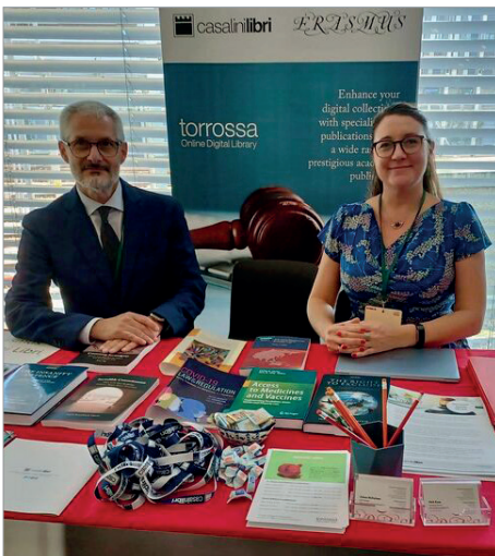
Abbiamo partecipato all'International Association of Law Libraries Annual Course a Ginevra.

Con la continua crescita delle nostre collezioni di Torrossa Open - contenuti digitali in accesso aperto - e sostenendo le biblioteche e gli istituti di ricerca nell'approvvigionamento e nella gestione dei contenuti digitali con un focus sull'interoperabilità, continuiamo a portare avanti la nostra missione di fornire il migliore e più ampio possibile accesso alla ricerca accademica. Attualmente inoltre stiamo lavorando all'implementazione dello standard COUNTER 5.1 e ci auguriamo di renderlo presto disponibile per i nostri clienti.