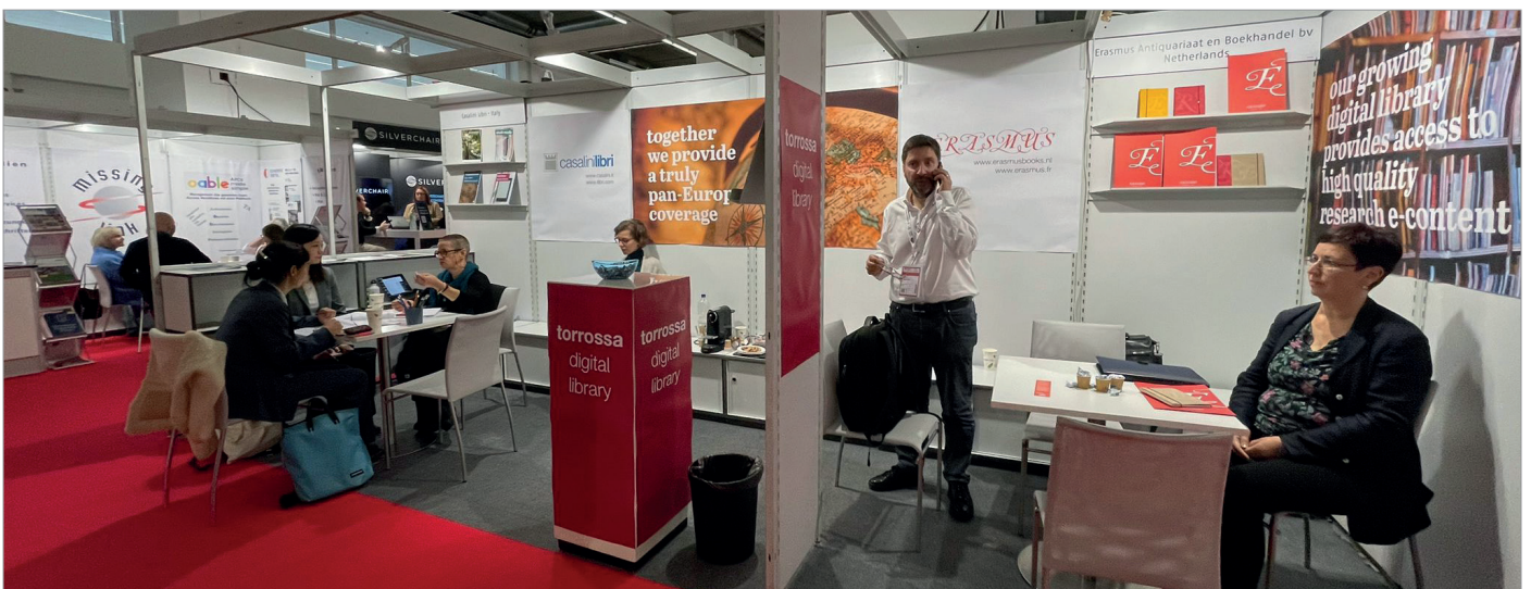
In ottobre siamo stati alla Fiera del Libro di Francoforte, con uno stand condiviso con Erasmus Boekhandel.

Il Torrossa Retreat 2024 si svolgerà giovedì 18 Aprile presso il Nuovo Teatro di Fiesole. Maggiori informazioni possono essere trovate sul sito www.torrossaretreat.org .